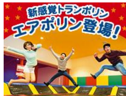
《スポッチャ HP より掲載》