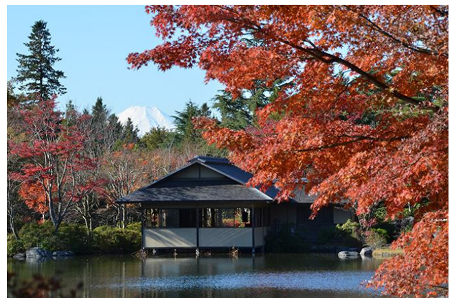
昭和記念公園 HP より