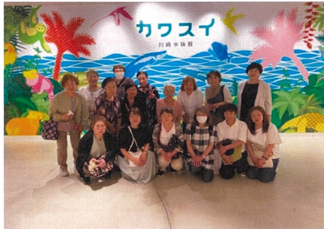
カワスイさんの フォトスペースで記念写真！

令和8年6月24日(水)川崎水族館(カワスイ)に行ってきました。 母子・寡婦対象でしたが、平日ということもあり寡婦さんのみ参加でした 17名で“大人カワスイ”を満喫しました！ 三菱化工機さま無料招待券をありがとうございました カワスイさんいつもありがとうございます