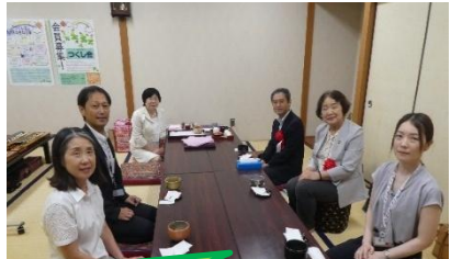
結構なお手前でした!