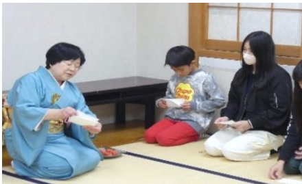
茶道体験お抹茶と和菓子を頂きました