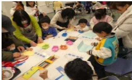
駄菓子を買うためのお財布作り